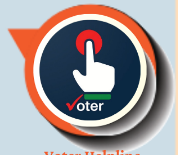
Voter Helpline App

ഓൺലൈനായി രജിസ്റ്റർ ചെയ്യുക അല്ലെങ്കിൽ നിങ്ങളുടെ വിശദാംശങ്ങൾ ഇവിടെ പരിശോധിക്കുക