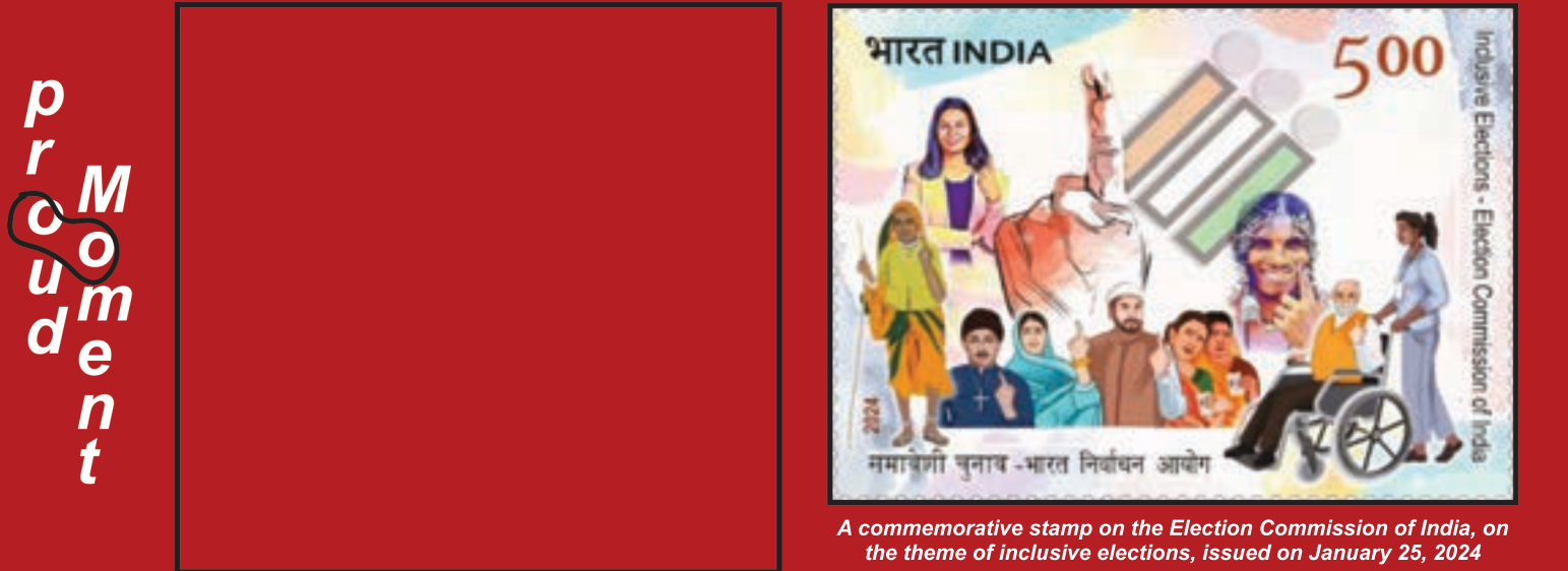
A commemorative stamp on the Election Commission of India, on the theme of inclusive elections, issued on January 25, 2024

ഇൻക്ലൂസീവ് ഇലക്ഷൻസ് എന്ന വിഷയത്തെ മുൻനിർത്തി 2024 ജനുവരി 26ന് പുറത്തിറക്കിയ തിരഞ്ഞെടുപ്പ് കമ്മീഷൻ ഓഫ് ഇന്ത്യയുടെ സ്മരണാർത്ഥമുള്ള സ്റ്റാമ്പ്.