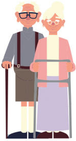
100 വയസ്സായ 2.18 ലക്ഷം വോട്ടർമാർ