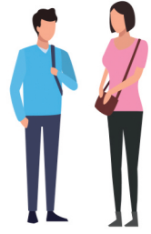
20-29 വയസ്സിനിടയ്ക്കുള്ള 19.74 കോടി ചെറുപ്പക്കാരായ വോട്ടർമാർ