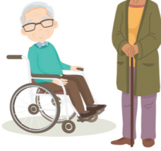
85 വയസ്സിനും അതിനു മുകളിലുമുള്ള 82 ലക്ഷം വോട്ടർമാർ