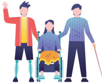
88.4 ലക്ഷം PwD വോട്ടർമാർ