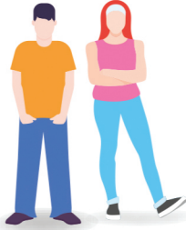
18-19 പ്രായക്കാരായ 1.8 കോടി കന്നി വോട്ടർമാർ